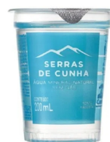
Água Sem Gás Copo 200ml Cód. 4990