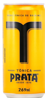
Tônica lata 269mL Cód. 2916