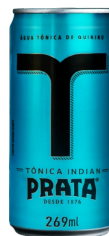
Tônica Indian lata 269mL Cód. 3880