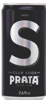
Club Soda lata 269mL Cód. 2934