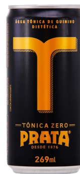
Tônica Zero lata 269mL Cód. 2923