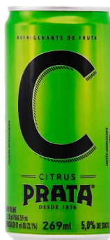
Refrigerante Citrus Lata 269ml Cód. 2932