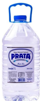
Água Natural Galão Pet 5 L Cód. 3207