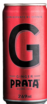
Ginger lata 269mL Cód. 3863